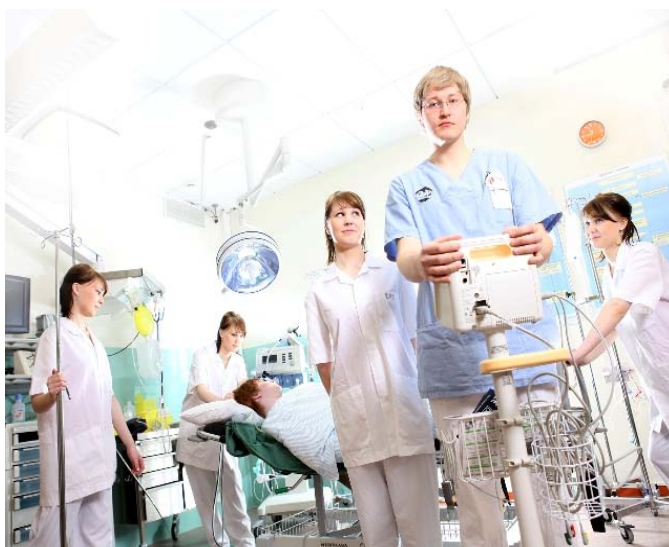
Lapissa miesten osuus sosiaali- ja terveysalalla on 12 %.

Tärkeimmiksi syiksi koulutukseen haakeutumiselle opiskelijat nimesivät hoiva-alan hyvät työllisyysnäkökymät, omien työllisyysnäkökymien parantamisen ja kiinnostuksen alaan. Useimpien tavoitteena oli selkeästi uuden ammatin hankkiminen. Joidenkin kohdalla enemmänkin halu kurkistaa itselle vieraalle, mutta kiinnostavalle alalle. Koulutus nähtiin sopivaksi väyläksi edetä ammattitutkintoon valmistavaan koulutukseen.