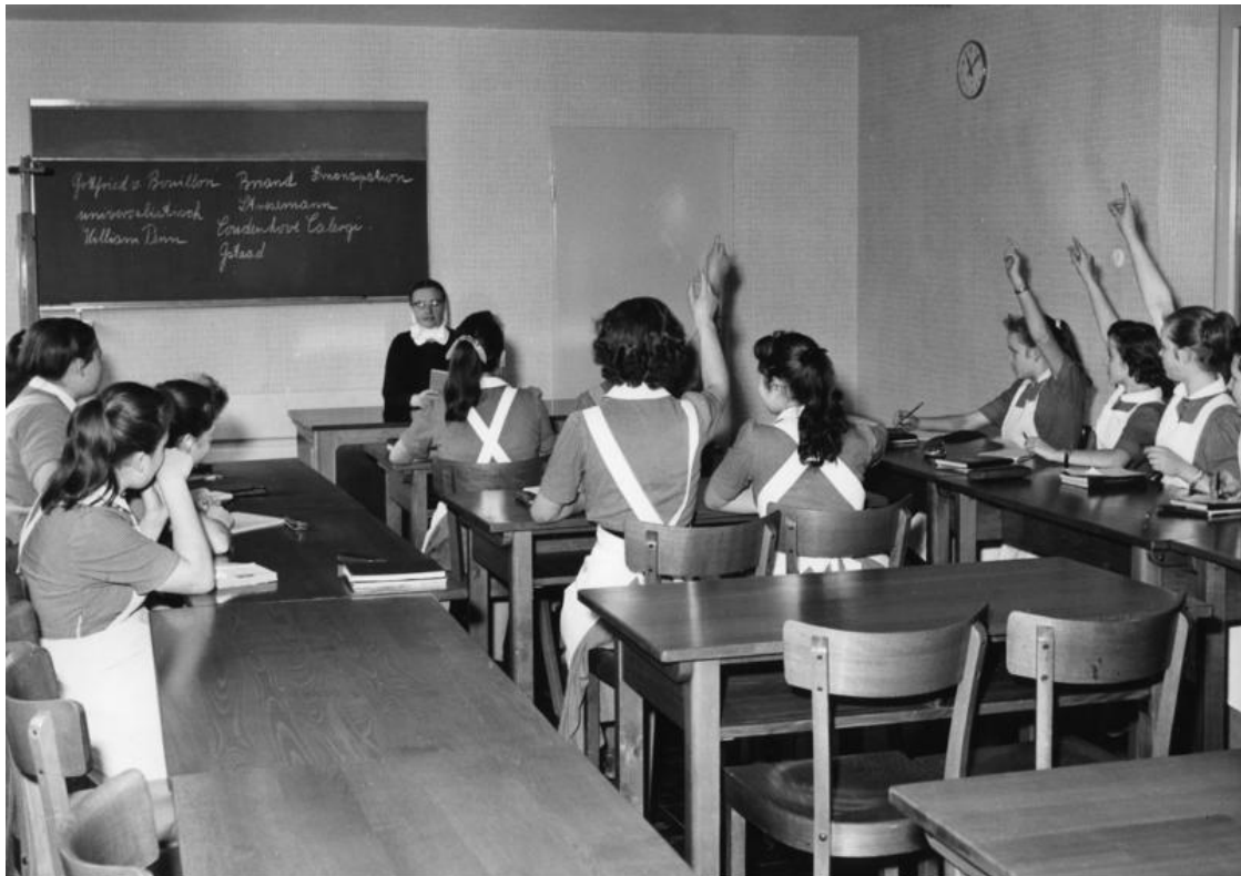
11. Januar 1958

Ei ilmeisesti riitä, että ammattijärjestöt, työnantajat, oppilaitokset ja jopa hallitusohjelma julistavat, että sukupuolen mukaista työnjakoa tulee purkaa. Kaivattaisiin enemmän konkreettisia tekoja ja edes pikuisen äänekkäämpiä puheenvuoroja asian edistämiseksi. Puheenvuorojen käyttäjät vain ovat hukassa.