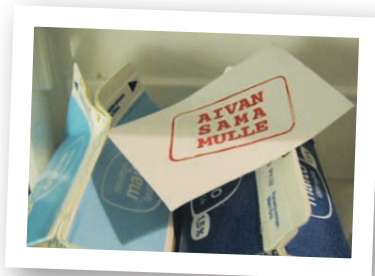
TASA-ARVOA KODIN ASKAREISIIN