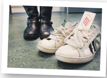
TASA-ARVOA KAVEREIDEN KESKEN