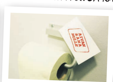
TASA-ARVOA OMAAN AIKAAN